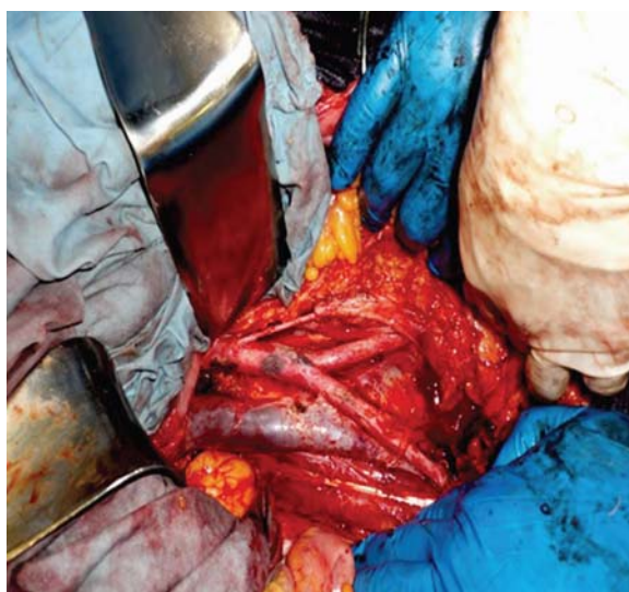
Рис. 1. Парааортальная и тазовая лимфодиссекция

У большинства больных раком яичников, поступающих в онкологические стационары, диагностируются запущенные стадии процесса (70–80%), поэтому в последние два десятилетия объем оперативного вмешательства значительно расширился, предпочтение отдается условно радикальным операциям с максимальным удалением практически всех пораженных опухолью тканей. В связи с чем, наряду со стандартной при злокачественных новообразованиях яичников экстирпацией матки с придатками, удалением большого сальника, забрюшинной лимфаденэктомией выполняют резекцию вовлеченных в опухолевый процесс петель кишок, аппендэктомию, спленэктомию, перитонэктомию и т.п. [3, 4, 5]. Кроме того отметим, что рак яичников часто рецидивирует, поэтому высока вероятность повторных операций, что требует от хирурга особенно серьезно подходить к вопросу профилактики спаек. На рис. 1, 2, 3 представлено клиническое наблюдение применения КолГАРА после удаления рецидивной опухоли и двусторонней лимфаденэктомии в связи с рецидивом рака яичников, расположенного в забрюшинном пространстве малого таза слева. Опухоль размерами 12×12×8 см локализовалась пристеночно с глубоким врастанием в стенку таза, с вовлечением магистральных сосудов и выраженным послеоперационным спаечным процессом.